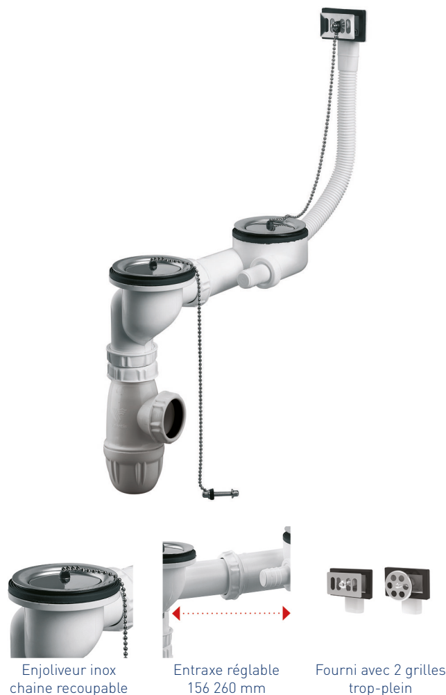
Enjoliveur inox chaîne recoupable